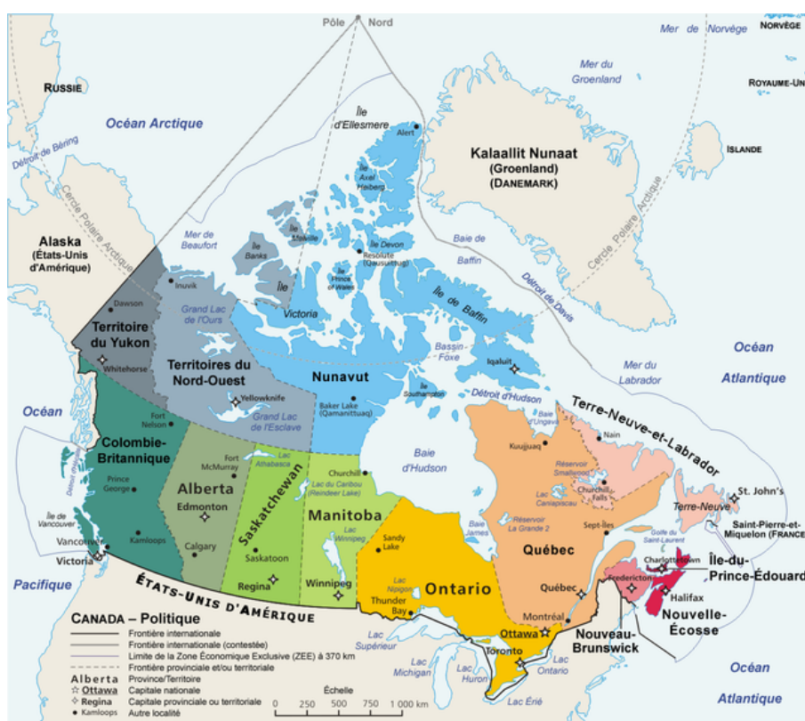
Carte administrative du Canada

Tout d'abord, comme nous pouvons le constater dans la carte ci-dessous, la Saskatchewan se situe à la frontière ouest du Manitoba et à l'est de l'Alberta. Elle se situe également à la frontière nord-ouest du Dakota du Nord 21 et à la frontière nord-est du Montana 22 .